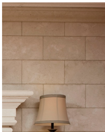
Décalage 1/2, plein, 1/2, plein etc.